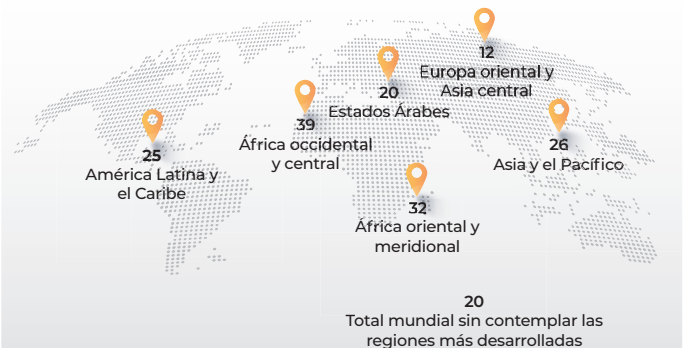
Porcentaje de mujeres de 20 a 24 años que contrajeron matrimonio o empezaron a vivir en unión libre antes de cumplir 18 años (2015-2019)

Fuente: Elaboración propia con información de UNFPA (2020).